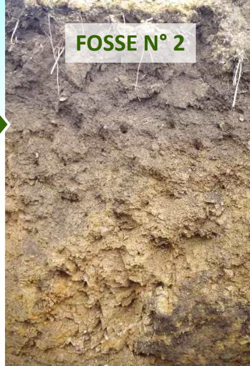
FOSSE N° 2