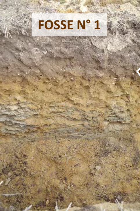
FOSSE N° 1